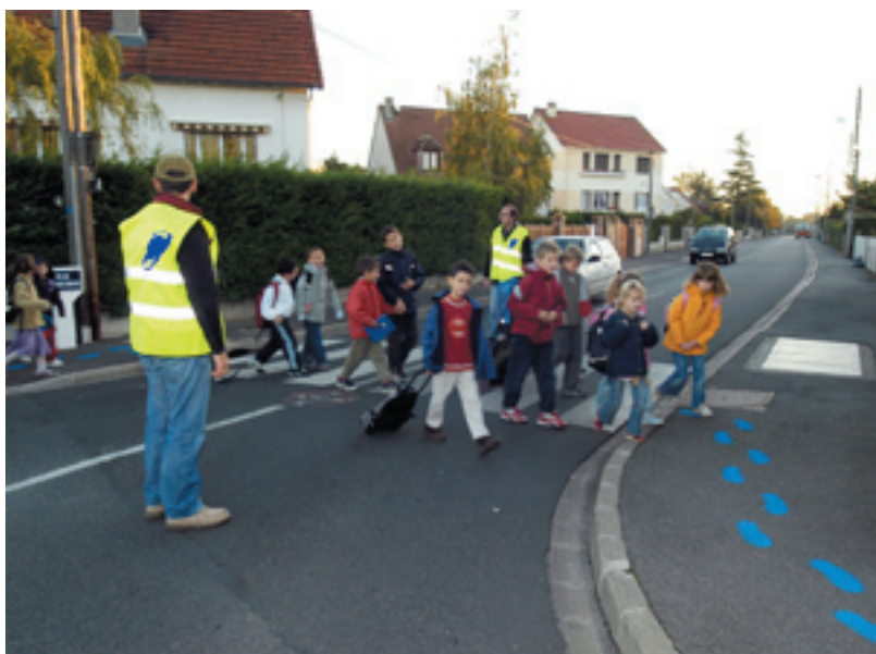
Des parents accompagnateurs sur chaque ligne de bus pédestre