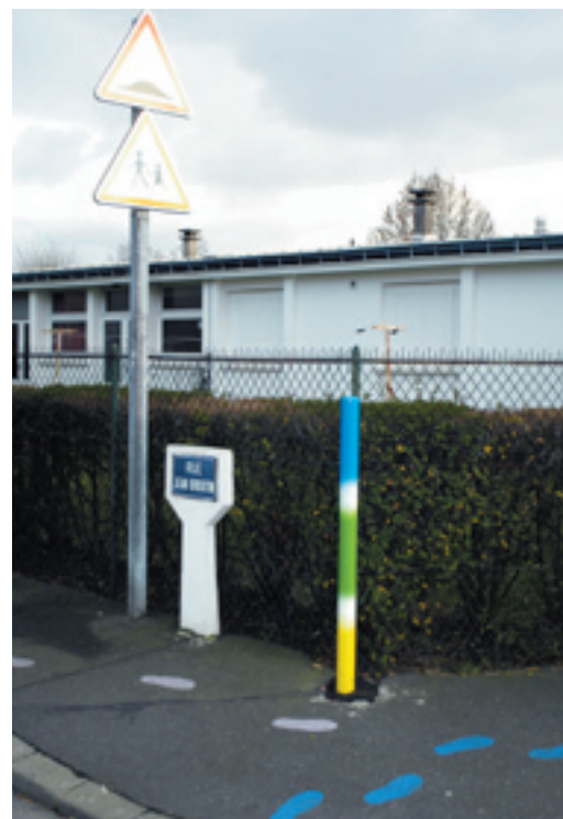
Des petits pas tout au long du trajet