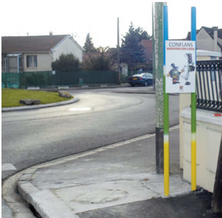
Une signalétique visible avec des totems à chaque arrêt