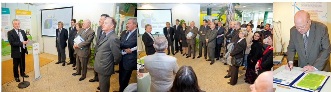
Cérémonie officielle de signature de la Convention des Maires, le vendredi 3 avril 2009

Les actions concrètes d'Arc de Seine seront formalisées dans son Plan Climat qui est en cours d'élaboration. Il constituera le volet énergie-climat de son Agenda 21 communautaire. Actuellement, en phase diagnostic, un bilan carbone de son patrimoine et du territoire est en cours d'élaboration.